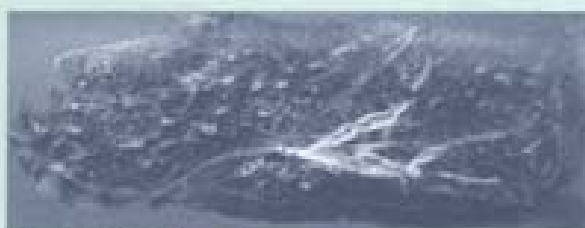
ปอดที่ดูดซึมสารพิษจากบุหรี่