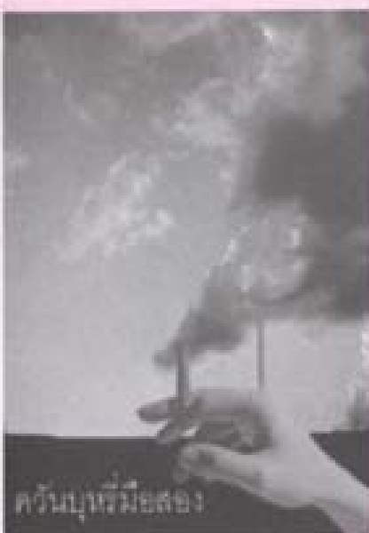
ควันบุหรี่มือสอง