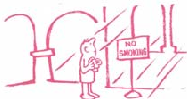
Figure : Michael Segel. "Smoking and Bars : A guide for policy makers" The California Smoke-free Bar Program, American Lung Association, 1998.

ข้อเท็จจริงเหล่านี้ตรงข้ามกับสิ่งที่บริษัทบุหรี่พูด นี่คือข้อพิสูจน์ว่า ลูกค้าส่วนใหญ่ไม่สูบบุหรี่ในบาร์ ประชาชนส่วนใหญ่ชอบให้บาร์ปลอดบุหรี่ และถ้าหากบาร์ทั้งหมดปลอดบุหรี่จะทำให้มีลูกค้าเพิ่มมากขึ้น หรือมาเที่ยวที่บาร์บ่อยครั้งมากขึ้น และใช้เวลาอยู่ที่บาร์ได้นานมากขึ้น