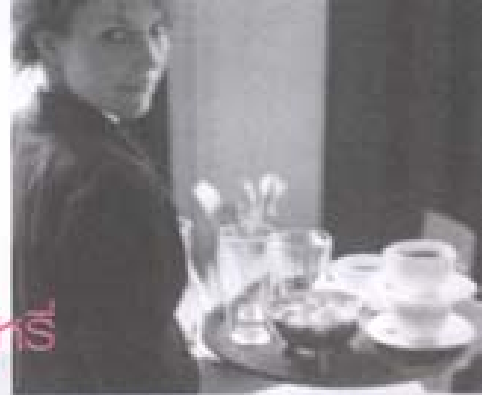
Smoke free bars and restaurants from 1st June 2004

From 1st June 2004, Section 8 of the Smoking ban Act obliges us to provide smoke free bars and clubs. This act also means to ensure employees have the right to work in a smoke free environment as all other employees.